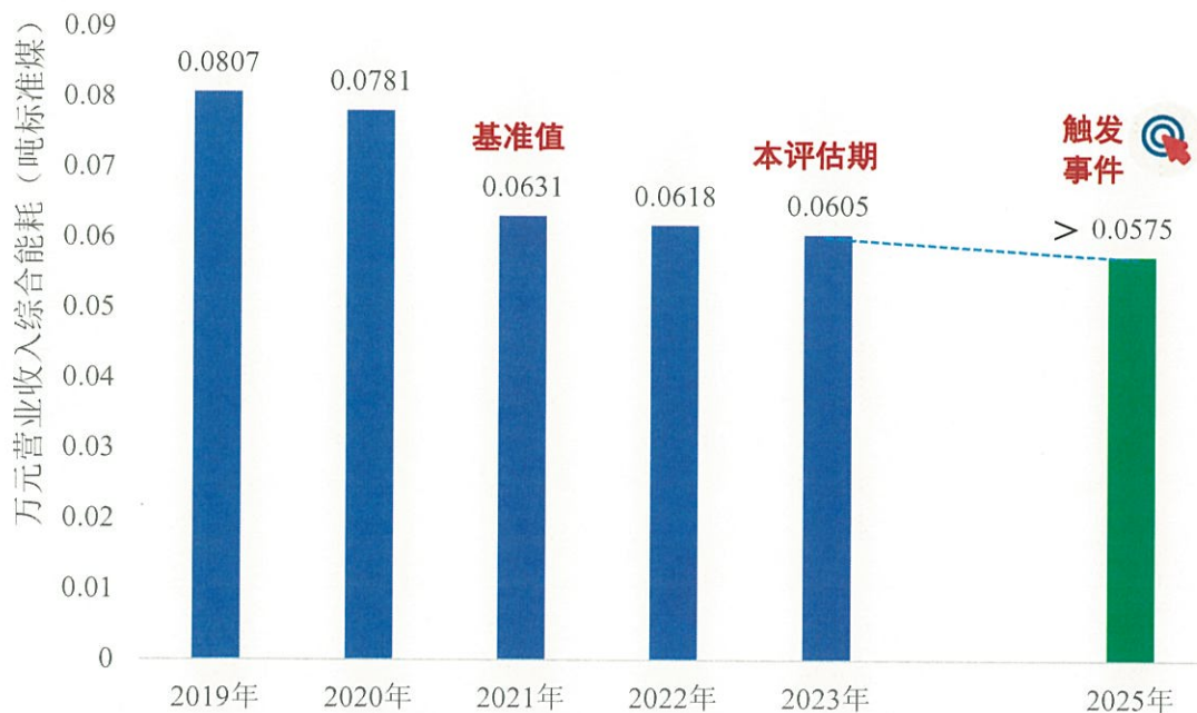
图 1 中国铁建可持续发展绩效目标（SPT）的实现进展情况

中诚信审阅了中国铁建提供的 2023 年度万元营业收入综合能源消耗数据，中国铁建 2023 年度消耗能源总量为 667.42 万吨标准煤，2023 年实现营业收入 110,244,478.00 万元。本期债券 2023 年度的可持续发展绩效目标的绩效结果：中国铁建万元营业收入综合能耗为 0.0605 吨标准煤。本期债券可持续发展绩效目标（SPT）的实现进展情况如图 1 所示。